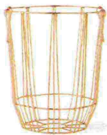
Rose Gold in rame con manici [JD Williams, ø cm 25x35h €30 il set da 2].

C'era una volta il classico gettacarte , sempre nascosto sotto il tavolo. Chi lo avrebbe detto che da Cenerentola dell'ufficio sarebbe diventato un gioiello da sfoggiare? In rete metallica diventa un oggetto 'grafico': dal brunito stile industrial fino al più glamour in oro rosa!