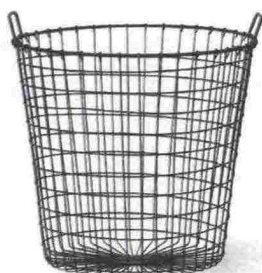
In filo metallico con manici [Gotwob Design House, ø cm 45x44,5h €31,50].