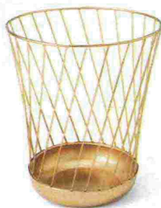
A tappo di champagne Odessa, in rame satinato [Made.com, ø cm 28x32h €29].