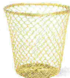
Rete d'alluminio, finitura ottone lucido [Zara Home, ø cm 29x30h €45,99].