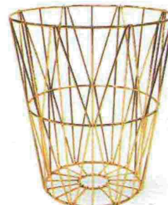
Hexa con sfumature effetto ossidato [The Range, ø cm 25x27h €12].