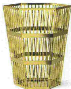
Tip Top di Richard Hetton, finitura oro [Ghidini1961, da ø cm 22x25h da €580].