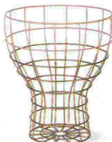
Sfumatura rosa + rame per Unity Bin [Oliver Bonas, ø cm 30,5x36,5h €39].