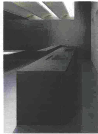
Da sinistra: portacandela Sticks , Ghidini 1961; top e lavello in lastra ceramica finitura Ossido Bruno di laminam.it ; tavolini in metallo finito bronzo patinato Venezia ( cantori.it ).