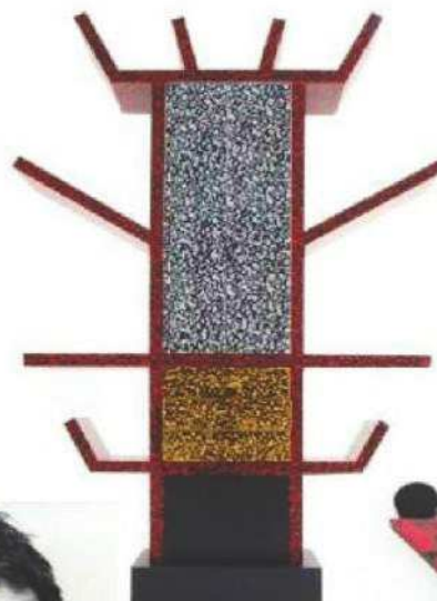
Buffet "Casablanca", 1981.