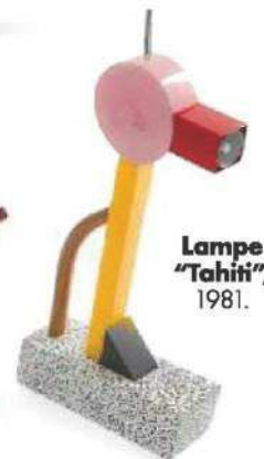
Lampe "Tahiti", 1981.