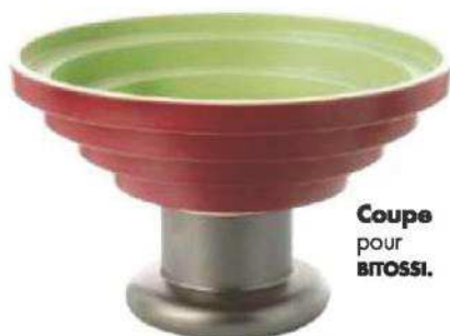
Coupe pour BROSSI.

● Du 9 au 12 novembre, Paris Expo Porte de Versailles, Paris-15 e . www.pucesdudesign.com