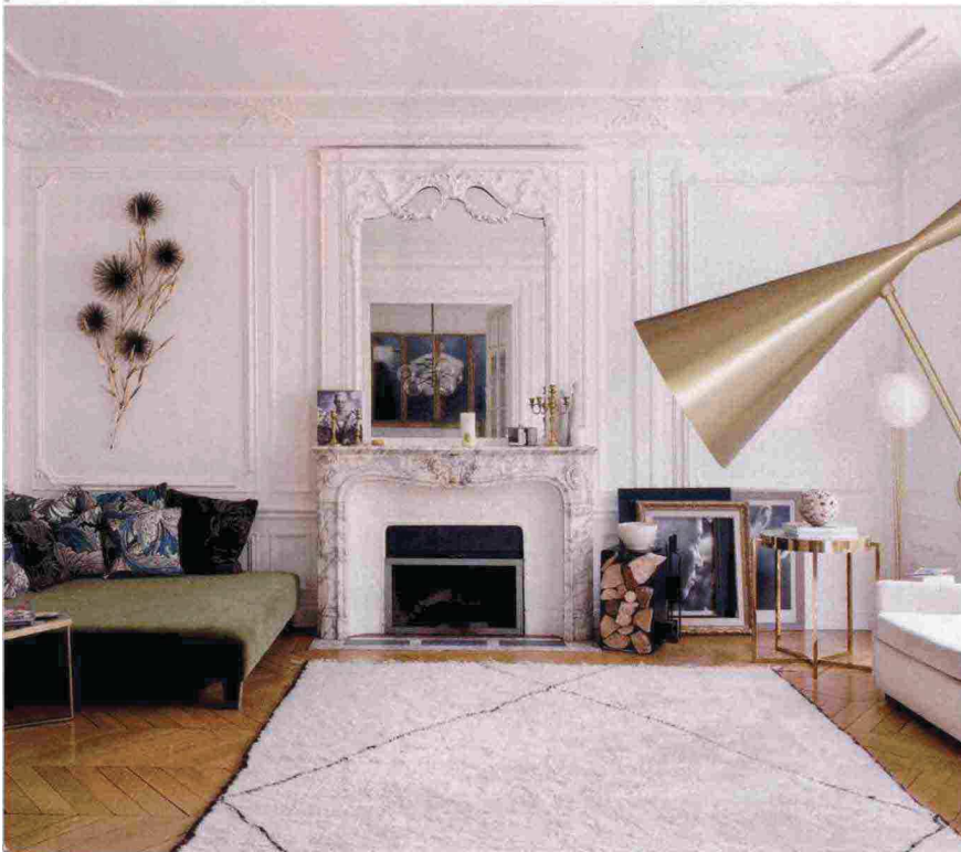
Sopra, nel living, il camino e gli stucchi di fine '800 convivono con il tappeto berbero della galleria Thanakra ( thanakra.fr ) di Parigi e il divano contemporaneo, formando un raffinato mix di epoche.