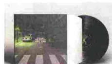
L'album Jameson Street Sounds 2018 .

Avete mai sentite parlare dei buskers ? In inglese, sono gli artisti di strada. Che oggi trovano uno spazio tutto loro nel Jameson Street Sounds 2018 , primo album dedicato a questa realtà, con il supporto di Jameson Irish Whiskey: dal rock al folk, dallo swing al jazz... disponibile in vinile e in streaming su Spotify.