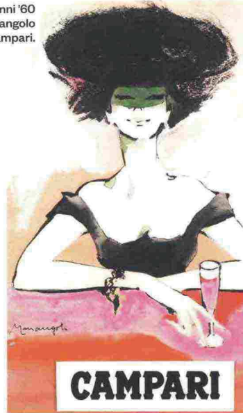
Disegno anni '60 di Franz Marangolo per Campari.