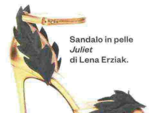
Sandalo in pelle Juliet di Lena Erziak.