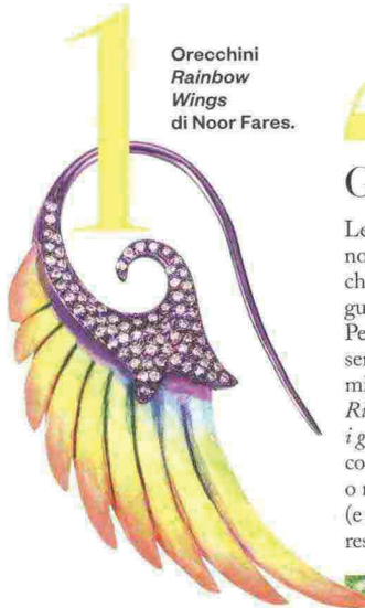
Orecchini Rainbow Wings di Noor Fares.