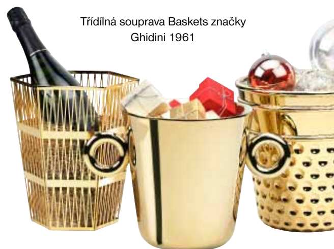
Třídílná souprava Baskets značky Ghidini 1961

Stefano Giovannoni přidal sestavu Omini, podnos s malými liliputány, kteří nesou držák na ubrousky, a slánku a pepřenku.