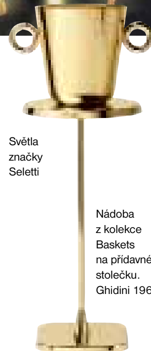
Světla značky Seletti