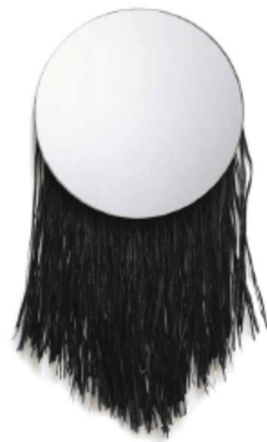
107 RIVOLI , miroir Tribù , par Charlotte Juillard, petit modèle noir à franges, verre poli et matériaux naturels — www.artemum.com