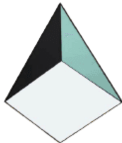
BOWER , Pyramid mirror , miroir à effets d'optiques, verre teinté et bois, 31 cm x 36 cm — www.bowernyc.com