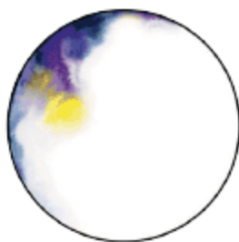
PETITE FRITURE , Francis , par Constance Guisset, miroir teinté bleu, jaune violet, verre poli et aluminium peint noir laqué, 60 cm — www.madeindesign.com