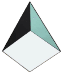
BOWER , Pyramid mirror , miroir à effets d'optiques, verre teinté et bois, 31 cm x 36 cm — www.bowernyc.com