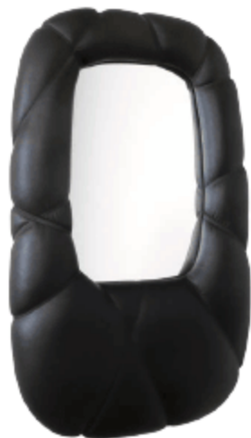
FARG & BLANCHE , Succession mirror , miroir en cuir et textile, plusieurs tailles et formes — www.fargblanche.com