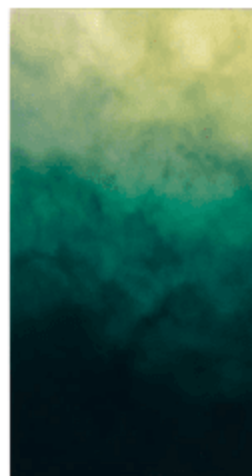
GERMANS ERMICS , Green ombré mirror , miroir rectangulaire en verre stratifié teinté vert et noir, 45 cm x 70 cm — www.germansermics.com