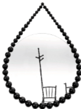
SJOERD VROONLAND , Bead mirror , miroir rond cerclé de billes noires. Tailles disponibles 60 cm, 80 cm, 100 cm — www.sjoerdvroonland.com