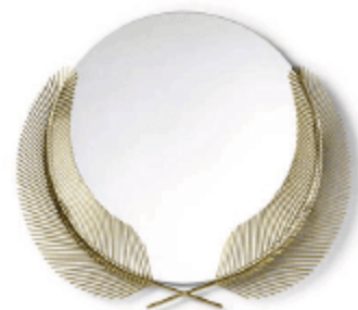
GHIDINI 1961 , Sunset mirror , série «Take me to Miami» par Nika Zupanc, miroir en verre poli et deux palmes en acier brossé, 87 cm — www.ghidini1961.com